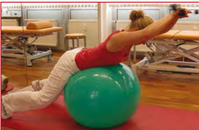
Abb. 13: Gezieltes BWS- und LWS-Training in Kombination mit Pezziball

Tomorrow Focus AG. Zeitschrift Fitforfun http://www.fitforfun.de/fitness/studiotraining/flexi-bar_aid_5039.html März 2008