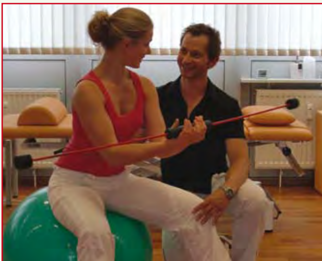
Abb. 1: Einsatz in der Rückbildungsgymnastik und zum Beckenbodentraining