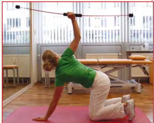
Abb. 8: BWS und LWS Mobilisierung kombiniert mit Tiefenmuskeltraining