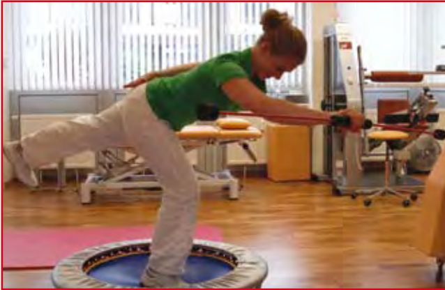
Abb. 10: Koordinatives Bein und Wirbelsäulentraining